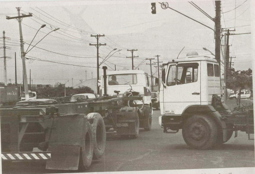
A Rua Idalino Pinês (Rua do Adubo) deve ser duplicada para facilitar o acesso dos caminhões aos terminais portuários, em Guarujá

Após a oficialização do negócio, a contratada terá cinco meses para apresentar o projeto de implantação da via expressa e ainda manter o compromisso de fazer o acompanhamento técnico das obras. Com a entrega do estudo, a Codesp poderá