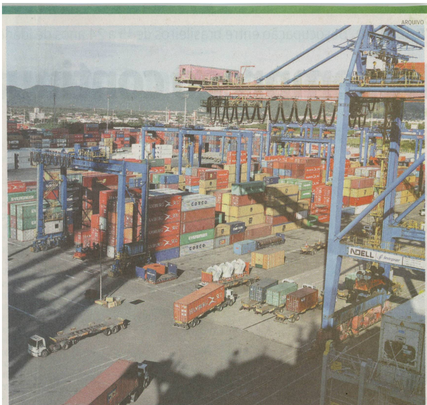
Medida atinge principalmente operadores de equipamento de manuseio de contêineres no pátio

prazo de estabilidade, a empresa iniciou as demissões pela diferença (83).