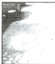
Buraco na rua

Preocupado com a situação, o cabeleireiro questiona a posição da empresa sobre esses problemas. "Será que vão arrumar as casas? A rua está sem asfalto. Vão providenciar os reparos? Poxa, pago imposto para destruírem minha casa?".